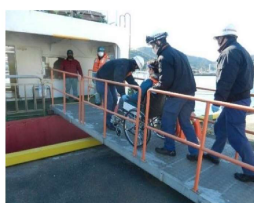
住民避難のイメージ (国民保護共同訓練より)