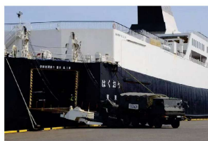
救援物資・車両の搭載 (防衛省災害派遣時の写真)