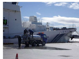
被災地での給水支援 (海上保安庁災害対応の写真)