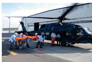
被災者等空輸のイメージ (防衛省災害対処に係る訓練より)