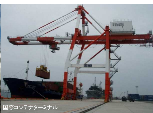
国際コンテナターミナル