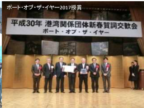
ポート・オブ・ザ・イヤー2017授賞