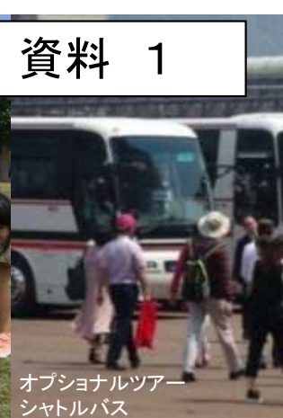
オプションツアー シャトルバス