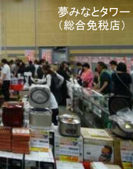
夢みなとタワー (総合免税店)