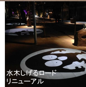
水木しげるロード リニューアル