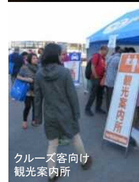
クルーズ客向け 観光案内所