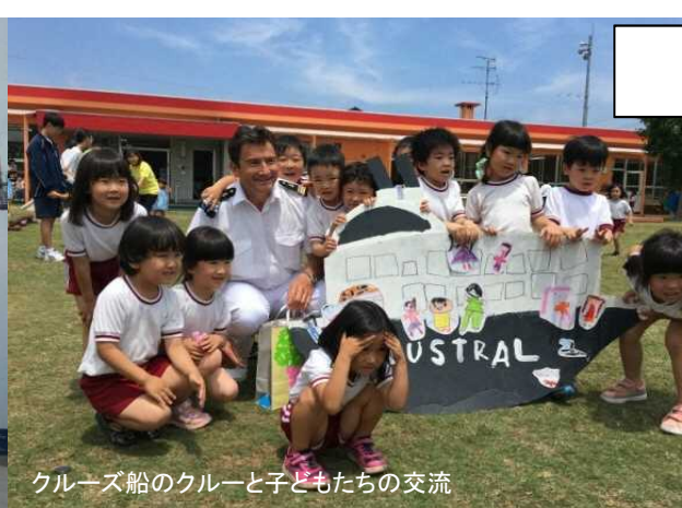
クルーズ船のクルーと子どもたちの交流