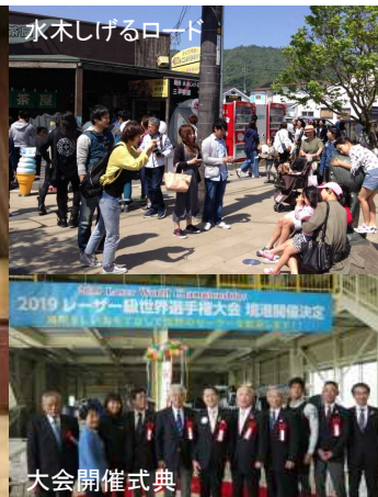
水木しげるロード